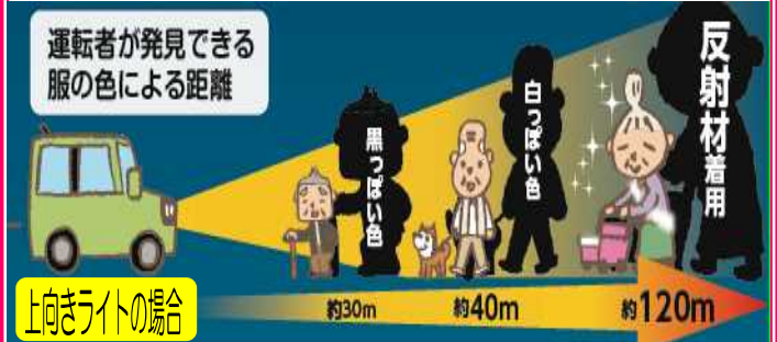
上向きライトの場合

夕暮れ時や夜間は、明るい服装や 反射材 を活用して周りに自分の存在を知らせるとともに、信号や横断歩道がある場所で横断するなど安全な行動を心掛けましょう。