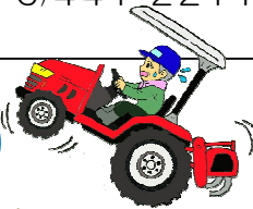
県内の農作業用自動車の類型別事故件数(H28~R2)