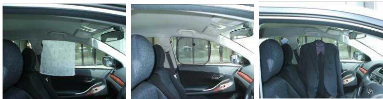
カーテンを開ける サンシェード(日よけ)を取り付ける 補助取手にスーツなどをかける