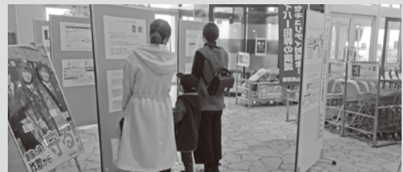
2月16～22日：イオンモール高岡