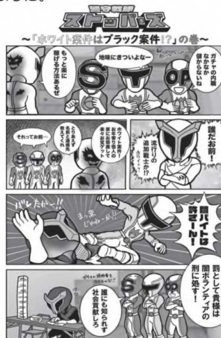
高岡龍谷高等学校美術部作

「警守戦隊ストッパーズ～ホワイト案件はブラック案件！？の巻～」と題した右記のマンガは、今後闇バイト防止を若年層に広く周知していくために活用していく予定です。