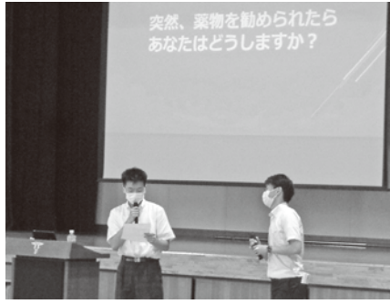
6月9日 高岡商業高校