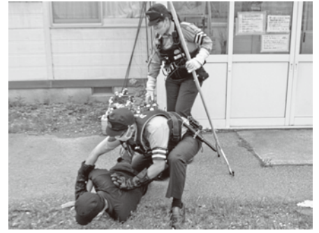
7月12日 木津小学校学童教室

8月1日、志貴野高校は高岡七夕まつりに合わせて特殊詐欺被害防止を祈願した七夕飾りを作成し、クルン高岡に設置しました。またオープニングイベントにおいて特殊詐欺被害防止を呼びかけました。