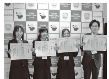
高岡市農業協同組合 佐野支店

特殊詐欺被害等を阻止した各支店や従業員の方々に、高岡警察署長から感謝状を贈呈し、それぞれ「特殊詐欺被害防止推進店・推進員」に任命させていただきました。