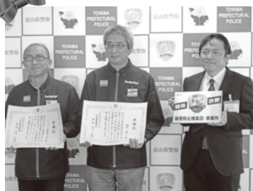
ファミリーマート 高岡駅南一丁目店