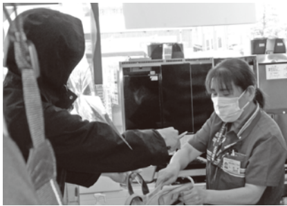
セブンイレブン高岡本郷二丁目店

高岡市内の北陸銀行、富山第一銀行、セブンイレブンなど数店舗において強盗訓練を実施しました。