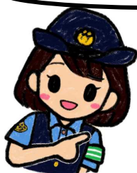
高岡署管内の交通事故発生状況 (10月17日現在)