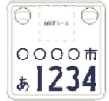
通常の原付よりも小型化！