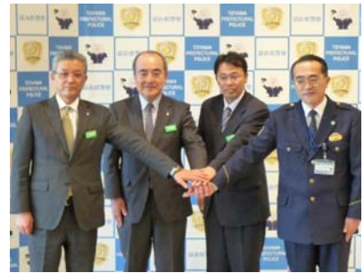
北陸銀行、富山銀行、富山第一銀行と富山県警察が連携して取り組みます。