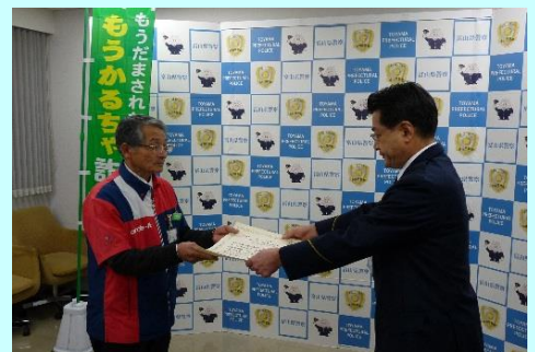
サークルK富山針原店オーナーに感謝状が贈呈されました

AさんがサークルK富山針原店を訪れ、携帯電話で犯人の指示を受けながらマルチメディア端末を操作した後、レジで26万円分の電子マネーを購入しようとしたところ、高額購入及び携帯電話を使用しながらの端末操作を不審に思った同店店長がAさんに警察への相談を勧めたことにより、被害を未然に防止することができました。